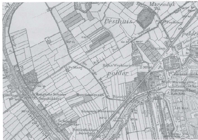
Fragment van een topografische kaart van Leiden en omgeving met daarop Kampong Makassar .