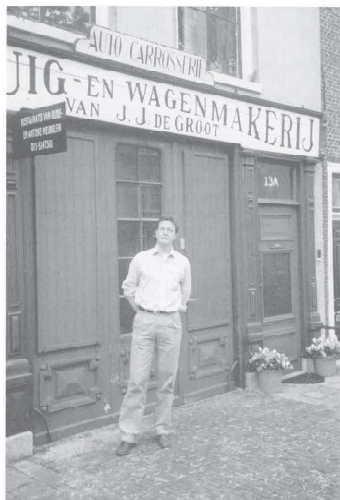
De nieuwe voorzitter in een passende entourage.