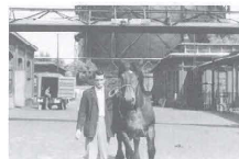
Een romantische foto van vroeger tijden met een paard en (vermoedelijk) diens eigenaar.

De paardenslachthal op het vroegere slachthuisterrein aan de Maresingel is begonnen aan een tweede leven. Het gebouw, dat bijna honderd jaar in gebruik is geweest, dateert van de jaren 1901-1903 en is ontworpen onder verantwoordelijkheid van de toenmalige gemeente-architect H. Paul. Het komt in gebruik als het gemeentelijk informatiecentrum voor de bouw van een nieuwe woonwijk op het slachthuisterrein, die de naam Nieuw Leyden heeft gekregen.