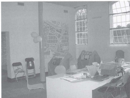
Frise, vrolijke ruimten in het vernieuwde gebouw.

* Bovenstaande tekst is tot stand gekomen op basis van gegevens van Pieter Meijers van het Leidse architectenbureau Van Swieten. Zie ook www.vanswietenarchitects.nl/gallery .