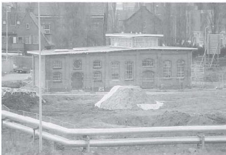
Nieuwe versie van de vroegere paardenslachthal tijdens de restauratie.

De gietijzeren raamkozijnen bleken deels vervangen te zijn door smeedijzeren exemplaren. Een aantal gietijzeren ramen en kozijnen is opnieuw gegoten. De daklantaarn, die was verdwenen, is opnieuw gebouwd op basis van oude bouwtekeningen. Het zat mee met de reconstructie van de daklantaarn, vooral ook omdat een deel van de gietijzeren ramen opgeslagen bleek op de hooizolder. De daklantaarn is door bouwbedrijf Du Prie uit Leiden in zijn geheel getransporteerd en op zijn plek gehesen. Gezien de afmetingen (ongeveer zes bij twaalf meter) bleken hiervoor speciale vergunningen en een nachtransport noodzakelijk, hetgeen ondanks het vroege uur veel bekijks trok. De daklantaarn, die in de originele staat niet toegankelijk