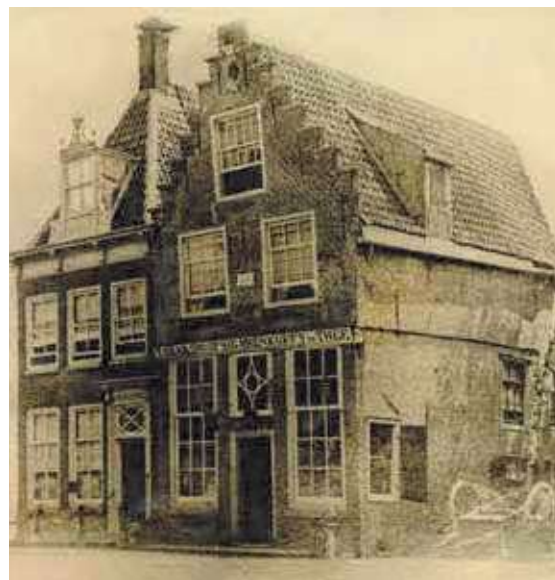
verkoop aan huis aan het Breed voor 1877

logischerwijs na de bakkersperiode aangebracht. De oudste reclametekst dateert daarom vermoedelijk uit het midden van de negentiende eeuw.