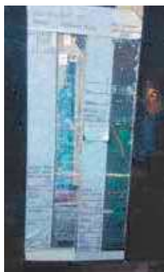
Kleurentrap met 27 lagen

Met behulp van pigmentanalyse door Matthijs de Keijzer van het Instituut Collectie Nederland kon de ouderdom van het vroegste afwerkstadium worden bepaald. In de verf waarmee de letters waren geschilderd bleek synthetische ultramarijn (blauw) te zijn toegepast, een verfstof die pas na 1830 op de markt kwam.