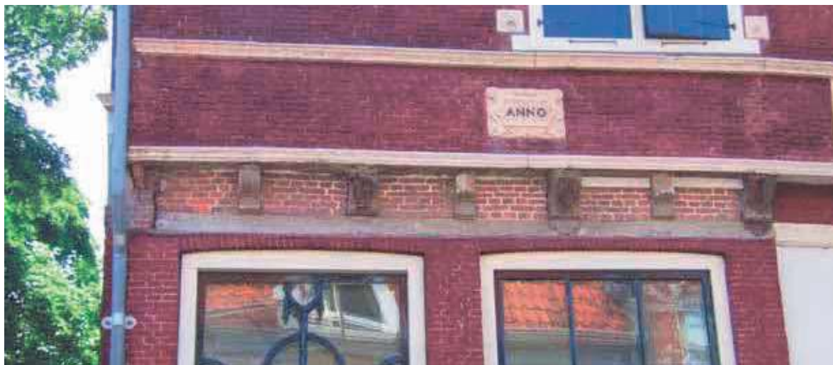
Afgehakte balkkoppen achter verwijderde plank

Bij het aanbrengen van de houten plank met de teksten in de 19 e eeuw waren de 17 e -eeuwse gebeeldhouwde balkkoppen in de gevel rigoureuus afgekap. Herstel was niet meer mogelijk dus de houten plank zou na herstel weer terug worden geplaatst. In eerste instantie was het plan de tweede tekst van 'schilder & glazenmaker' weer zichtbaar te maken. Uit het onderzoek kwamen echter oudere teksten tevoorschijn die nog uitzonderlijker waren. Op basis van technische haalbaarheid en de fraaie kleurstellingen werd besloten de tekst 'TABAK.