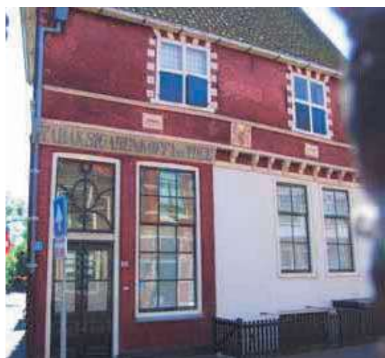
Gevel na restauratie

* P.C. Meijers is werkzaam bij bureau Erfgoed van de gemeente Hoorn