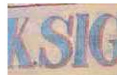
Tratteggio-techniek op letters