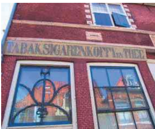
Reclamebord na oplevering

Bossuhuizen vanwege de geschilderde frieslijst op de gevel aan de Slapershaven met daarop de zeeslag van de West-Friezen tegen de Spaansgezinde vloot. Nu heeft echter ook de gevel aan het Grote Oost een bijzondere schildering, een 19 e -eeuws reclamebord dat toont hoe in Hoorn reclamevoering al in de negentiende eeuw plaatsvond.