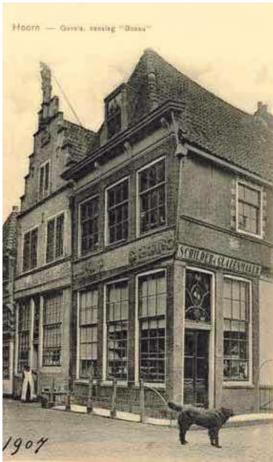
Reclame op Grote Oost 132 anno 1907

Op de hoek van de Slapershaven en het Grote Oost is onlangs weer een stukje stadshistorie zichtbaar gemaakt. Een eenvoudige, groen geschilderde plank tegen de buitengevel van Grote Oost 132, bleek een rijkdom aan historische reclameteksten te bevatten. Na zorgvuldig onderzoek is één van de oudste reclameteksten in Hoorn zorgvuldig blootgelegd en gerestaureerd. In sierlijke letters is de tekst 'TABAK.SIGAREN.KOFFY EN THEE' weer zichtbaar gemaakt.