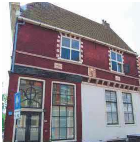
Gevel voor restauratie

Bossuhuizen vanwege de geschilderde frieslijst op de gevel aan de Slapershaven met daarop de zeeslag van de West-Friezen tegen de Spaansgezinde vloot. Nu heeft echter ook de gevel aan het Grote Oost een bijzondere schildering, een 19 e -eeuws reclamebord dat toont hoe in Hoorn reclamevoering al in de negentiende eeuw plaatsvond.