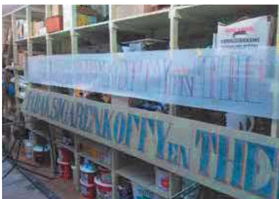
Onderzoek en restauratie in werkplaats

SIGAREN.KOFFY en THEE' vrij te leggen en te retoucheren in de oorspronkelijke kleurstelling. Leonieke Polman wist door middel van specifieke restauratietechnieken een balans te vinden tussen behoud van de oorspronkelijke letters en de aan te vullen letterdelen. Allereerst werd de oorspronkelijke tekst overgenomen op papier. Na het geheel opschonen en verwijderen van verflagen werd een egale fondtoon aangebracht