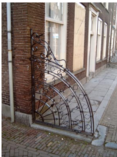
Stoep en stoephek