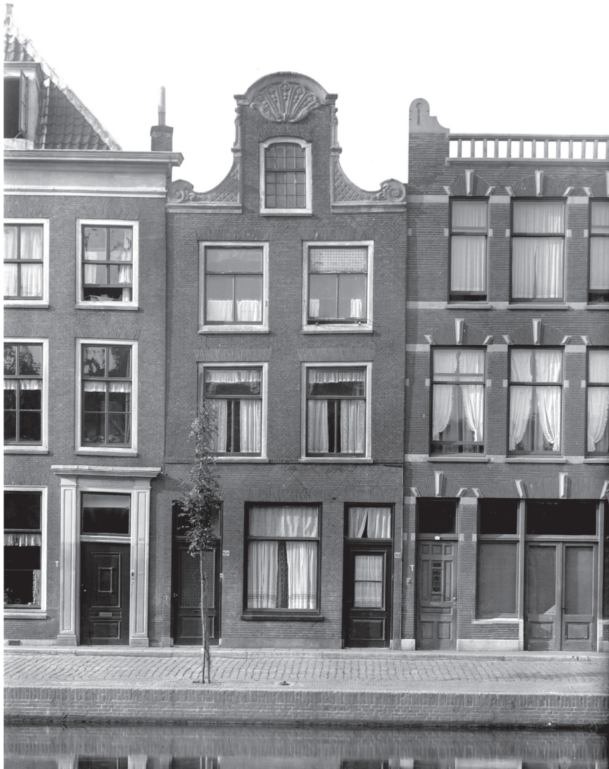
Voorgevel Oude Vest 103 anno 1930.

Ter hoogte van de eerste verdieping is een stalen ligger in het metselwerk opgenomen. Hierbij zijn alle aanwezige kinderbalken ingekort en opgelegd op een nieuwe strijkbalk met duivenjager profilering. Eén kinderbalk is nog voorzien van een pen. De kinderbalken in de vloerconstructie tegen de achtergevel zijn met zo'n verbindingspen opgelegd in de strijkbalk tegen de achtergevel. Conclusie hiervan is dat de huidige strijkbalk een ouder exemplaar heeft vervangen en daarbij meer naar binnen is gelegd ten behoeve van de nieuwe stalen ligger.