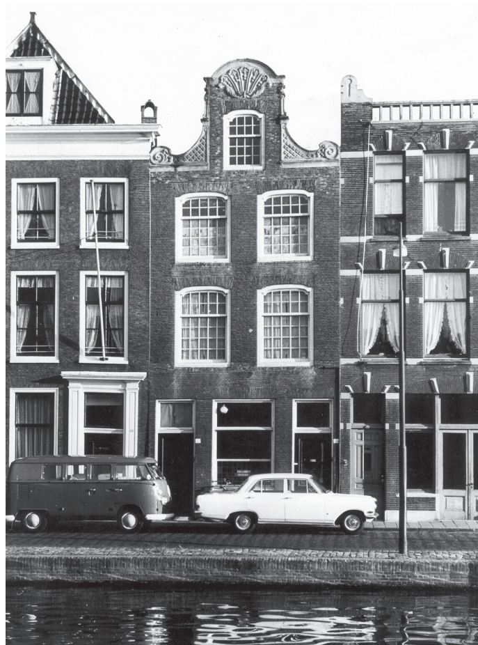
Oude Vest 103 anno 1967.