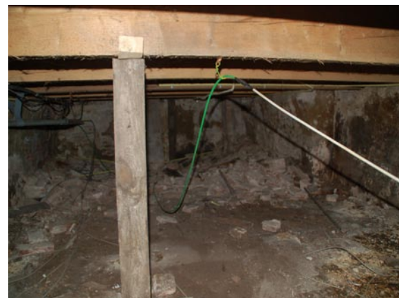
Kelder met enkelvoudige balklaag

Het onderzoek richt zich op eventueel nog aanwezige bouwsporen van vloerafwerkingen in het atrium uit de bouwperiode van 1840-1844.