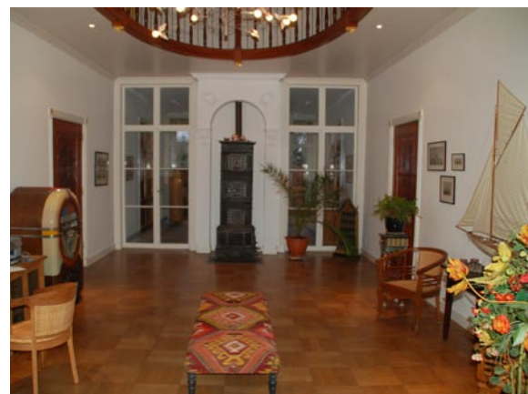
Atrium met parketvloer

De keuze van vloerafwerking dient op basis van andere uitgangspunten gemaakt te worden. Dit kan op basis van architectuurhistorische gegevens, bouwhistorisch onderzoek naar bouwfaserings of literatuuronderzoek.