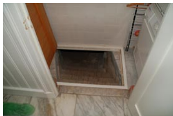
Kelder ingang via bijkeuken