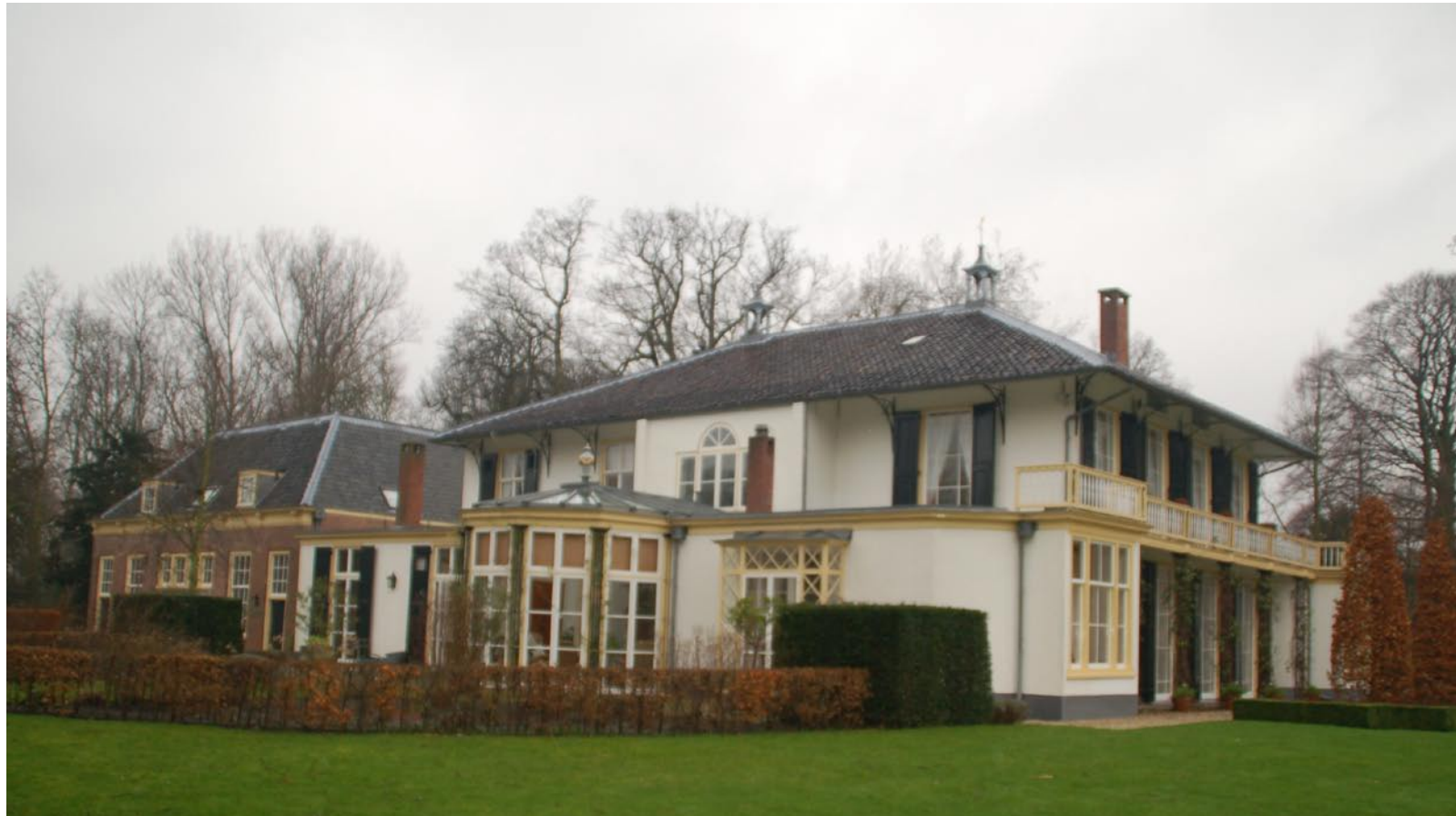
Voorgevel Rhijngest anno 2007

In opdracht van jonkheer Adriaan Leonard van Heteren Gevers (1796-1866) is de hofstede verbouwd in de huidige 'koloniale' stijl waarbij een nieuwe vleugel is bijgebouwd, de huidige oostvleugel. (3) Ten behoeve van deze vleugel is een deel van het bestaande pand gesloopt. Het atrium is in deze periode gerealiseerd.